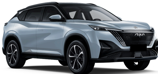
Сверкающий серебристый Чёрная крыша