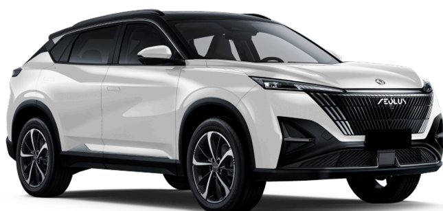
Искрящийся белый Чёрная крыша