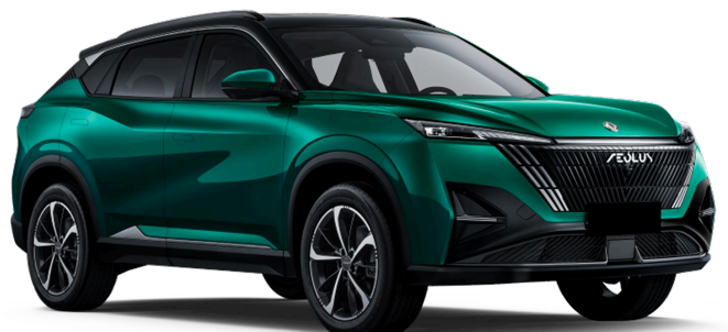
Насыщенный зелёный Чёрная крыша