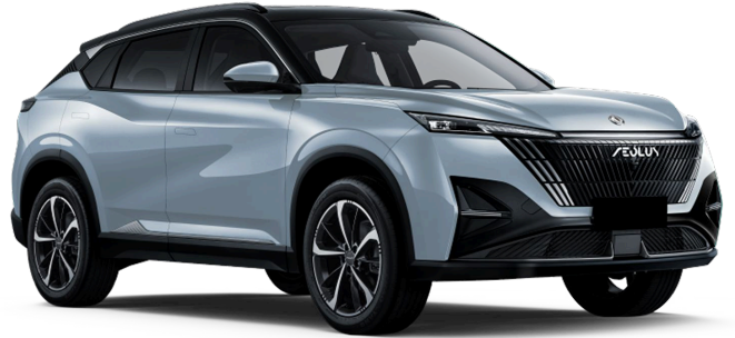
Сверкающий серебристый Чёрная крыша