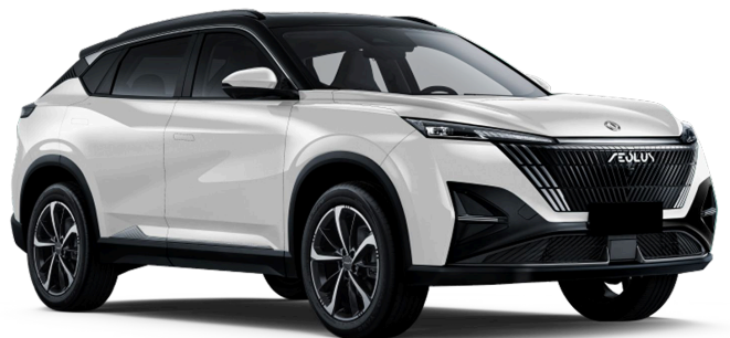
Искрящийся белый Чёрная крыша