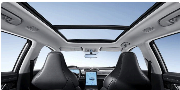
Чёрный с белой строчкой Цвет интерьера