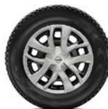
16" стальные диски с декоративными колпаками