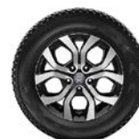
16" легкосплавные диски