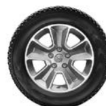
16" легкосплавные диски с внедорожным дизайном