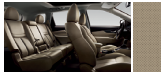
БЕЖЕВАЯ КОЖА С ПЕРФОРАЦИЕЙ