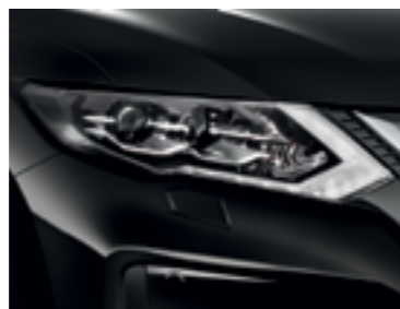
Черный — G41/M

M — металл, S — неметалл, PM — перламутр