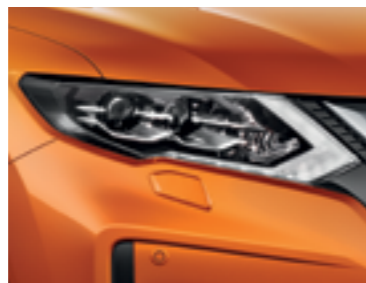
Оранжевый — EBB/M