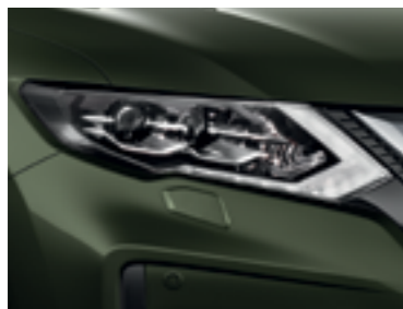
Оливковый — EAN/M