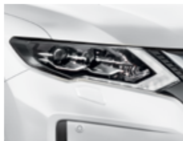
Белый — QM1/S