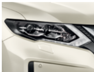
Белый перламутр — QAB/PM