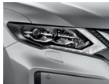
Серебристый — K23/M