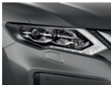
Серый — KAD/M