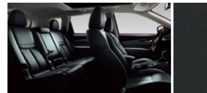
ЧЕРНАЯ КОЖА С ПЕРФОРАЦИЕЙ