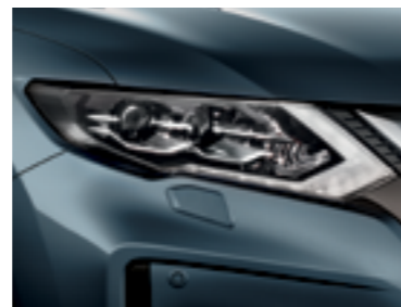
Синий — RAQ/M